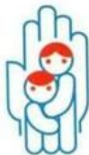
Комиссия по делам несовершеннолетних и защита их прав