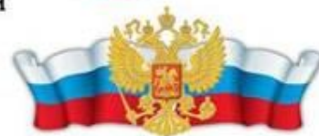
Министерство внутренних дел Российской Федерации